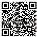
ワークショップ 申し込み QR

応募作品の返却は行いませんので、必要に応じて複写等を行っておいてください。また、著作権は応募者に帰属しますが、応募作品の利用に関する権利は、九州産業大学建築都市工学部建築学科に帰属するものとします。入選作品はホームページ等で公開する予定です。